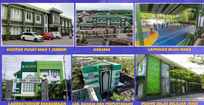
KANTOR PUSAT MAN 1 JEMBER